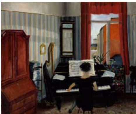
Sisäkuva, soittava nainen, 1931