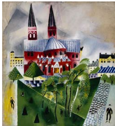
Johanneksen kirkko, 1918